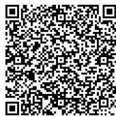
QRコードはデンソーウェーブの登録商標です。

「あいち電子申請・届出システム」と検索していただくか、こちらのQRコードよりお申込みください。