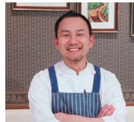
刈谷市総合文化センター2F