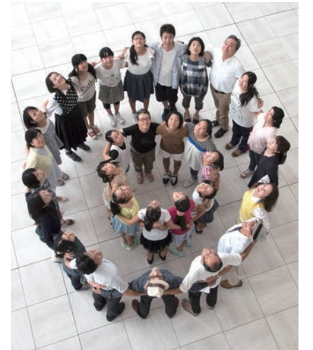
市民出演者の皆さん

日時 12/20(日) 14:00 ~ 会場 大ホール 料金 ¥1,800(税込・全席指定) 企画 文化工房かりや・刈谷市・刈谷市総合文化センター