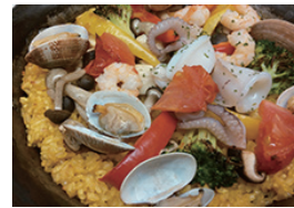
地中海パエリアランチ (スープ・ドリンクバー付き) ¥1,200(税込)

芦塚: “地中海カフェ”の看板を背負ってますから「地中海パエリア」は外せません。地中海と付けたのは、フレンチ、イタリアン、そしてスペイン料理の魅力をお客様に提供したかったから。このパエリアもムール貝やエビ、魚介はもちろん、キノコやブロッコリー、トマト(実は秋も旬!)など秋の食材もふんだんに使った自慢の一品です。ぜひお召し上がりくださいね!(談)