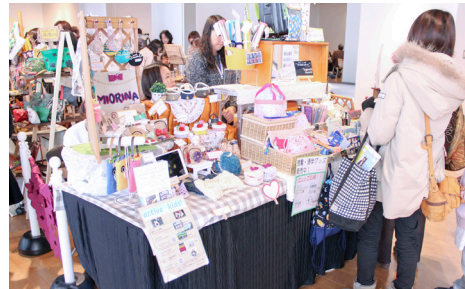
昨年のクリエイターズマルシェの様子

日時 3/9(金)～10(土) 9:30～16:30 会場 小ホール 料金 入場無料