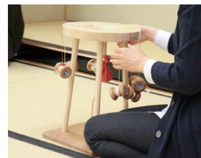
組みひもアクセサリー体験