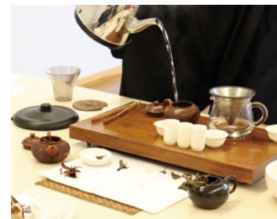
tea living. 中国茶体験