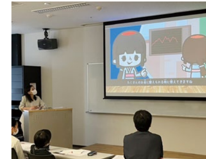
親子でお金の働きを学ぼう