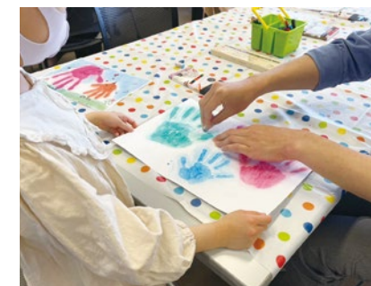
手が汚れないパステル手形アート