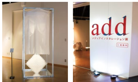
※昨年度の作品より

日時 2/22(木)~25(日) 12:00~19:00 (最終日のみ17:00まで) 会場 展示ギャラリー 料金 入場無料