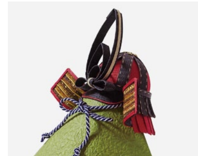
クラフトバンドで作る兜

開催日 3/9(土) 対象 刈谷市在住・在勤・在学の方 参加方法 要事前予約 ※定員に満たない講座については、締め切り後も受付する場合があります。