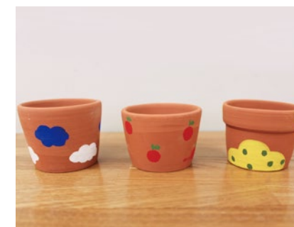
ミニ植木鉢色付け体験

写真の6講座のほか、親子向けの将棋教室や「ベイビーハープ」の演奏体験、愛知教育大学の学生によるSDGsカードゲームなど、全15講座を開講予定です。応募方法や講座の詳細は、2月1日号の市民だより、もしくはセンターHPをご覧ください。