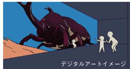
デジタルアートイメージ